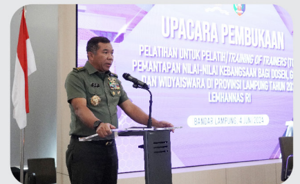
Lemhannas RI Gelar Pelatihan Untuk Pelatih di Provinsi Lampung