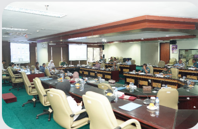
Lemhannas RI Diskusikan Potensi Konflik di Selat Taiwan