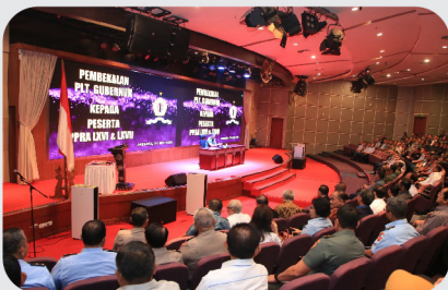
Plt. Gubernur Lemhannas Berikan Arahan kepada Peserta PPRRA 66 dan 67