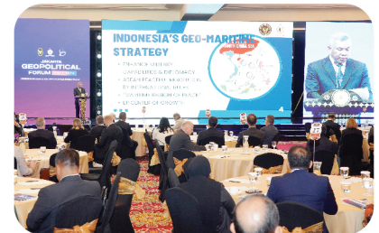
Lemhannas RI Selenggarakan Jakarta Geopolitical Forum VIII/2024