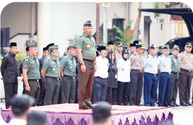
Plt. Gubernur Lemhannas RI Pimpin Upacara Bendera Bulan September