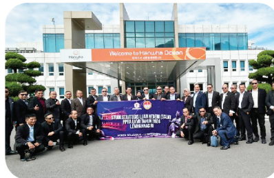
Sebagai Salah Satu Pilar Ekonomi Dunia, Korea Selatan Menjadi Tujuan SSLN